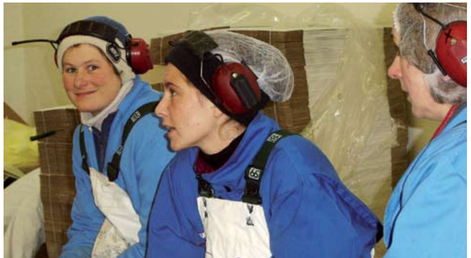
Félagsmönnum fjölgaði verulega á liðnu ári. Nýir félagsmenn eru 722 að tölu.

Í lok mars var gengið frá vinnustaðasamningi við Spöl. Samningurinn hefur sama gildistíma og kjarasamningurinn á hinum almenna vinnumarkaði eða til 30. nóvember 2010. Heildarhækkun launa starfsmanna gjaldskýlisins í nýjum samningi er um 32 þúsund krónur á mánuði. Einnig hækkuðu orlofs- og desemberuppbætur umtalsvert.