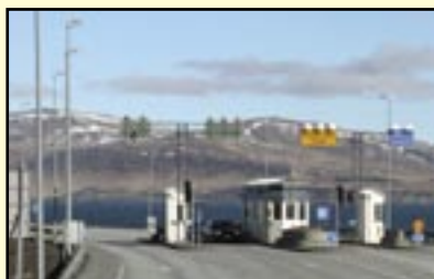
Félögum gefst kostur á að lækka sumarfrís- kostnaðinn með ýmsum hætti.

Félagar í VLFA, makar þeirra og börn innan 16 ára geta fengið frítt veiðileyfi í Eyrarvatni, Þórisstaðavatni og Geitabergsvatni í Svínadal. Einnig eiga félagsmenn frían aðgang að tjald- stæði á Þórisstöðum. Félagatal liggur frammi hjá staðarhaldara svo félagar geta einfaldlega mætt á svæðið með persónuskilríki.