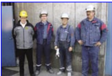
Formaðurinn ásamt starfsmönnum Norðáls.