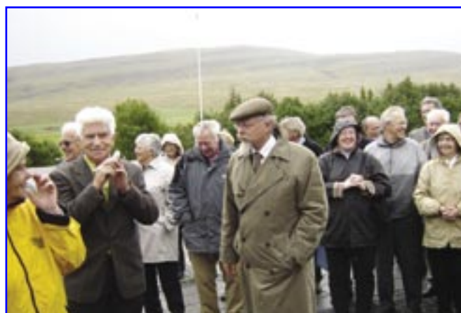
Litast um í Reykholti.