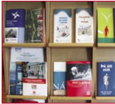
Fjöldi bæklinga um símenntun liggur frammi á skrifstofu félagsins.

Menntafélagið er skóli véltækni og siglinga og námskeiðabæklingur skólans,