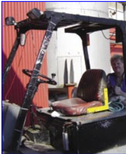
Rabbi reddari í HB Granda.