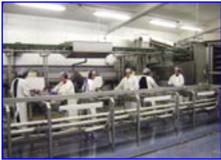
Stelpurnar á færibandinu í Laugafiski.

Félagar í Verkalýðsfélagi Akraness starfa á mörgum vinnustöðum í fjölbreyttum störfum