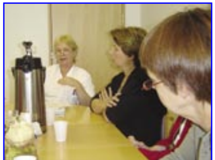
Frá samningafundi vegna kjarasamnings við starfsfólk SHA.