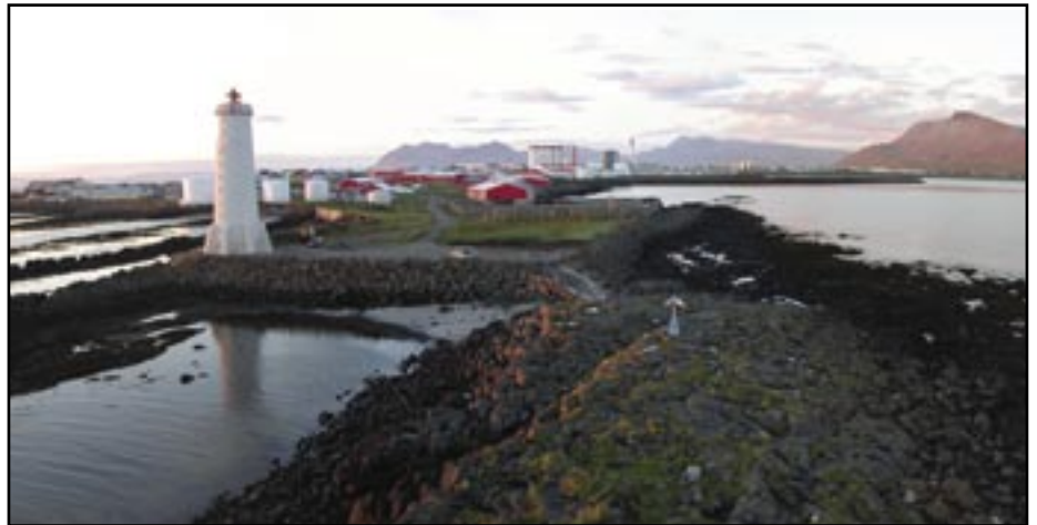
Horft yfir Breiðina úr gamla vitanum á Suðurflös.

Þessi hækkun markar tímamót í afkomu og öryggi félagsmanna VLFA.