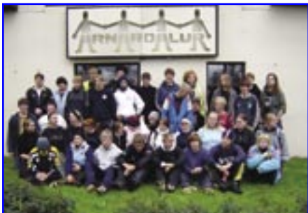
Frá kynningarfundum 16 ára unglinga í Arnardal.