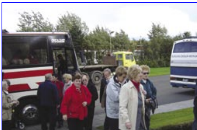
Frá ferð eldri félaga á liðnu bausti, ferðalangar stíga frá borði.